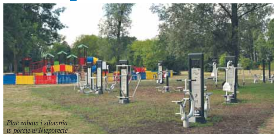
Plac zabaw i siłownia w porcie w Nieporęcie