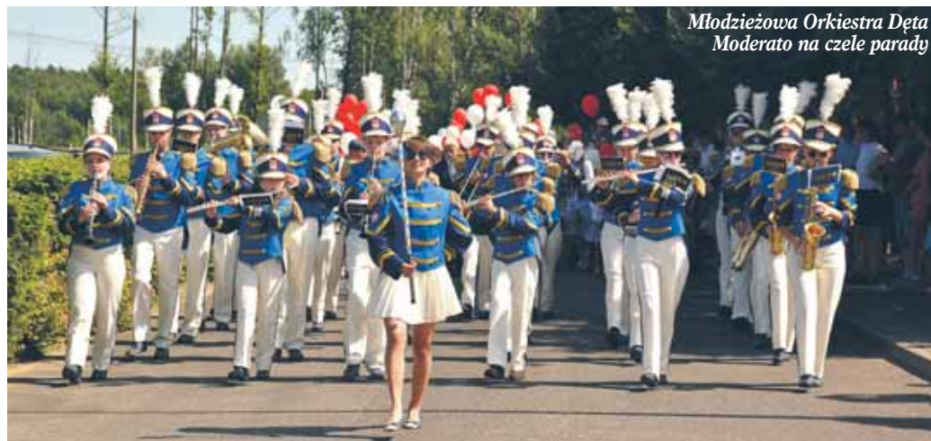
Młodzieżowa Orkiestra Dęta Moderato na czele parady