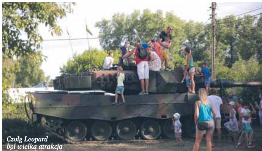
Czołg Leopard był wielką atrakcją