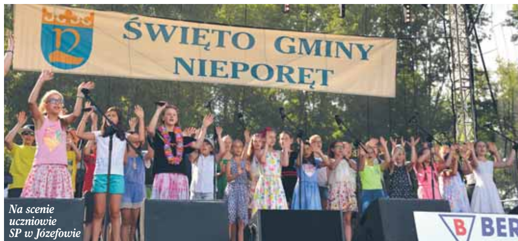
Na scenie uczniowie SP w Józefowie