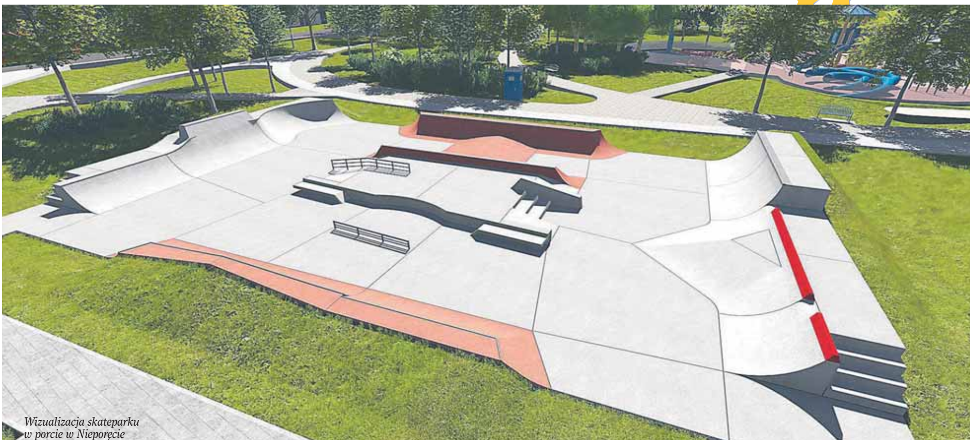
Wizualizacja skateparku w porcie w Nieporęcie

SOŁECTWA: Aleksandrów, Beniaminów, Białobrzegi, Izabelin, Józefów, Kąty Węgierskie, Michałów-Grabina, Nieporęt, Rembelszczyzna, Rynia, Stanisławów Pierwszy, Stanisławów Drugi, Wola Aleksandra, Wólka Radzymińska, Zegrze Południowe