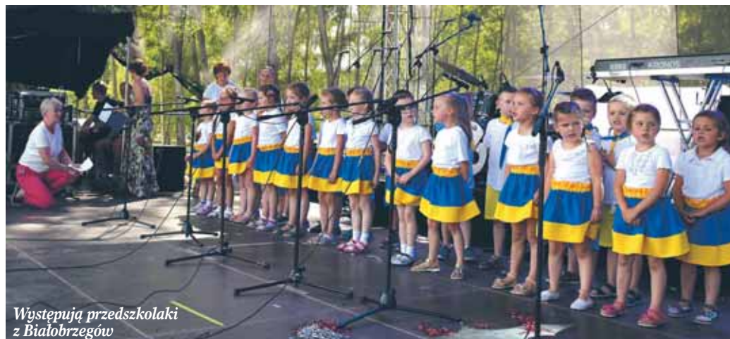
Występują przedszkolaki z Białobrzegów