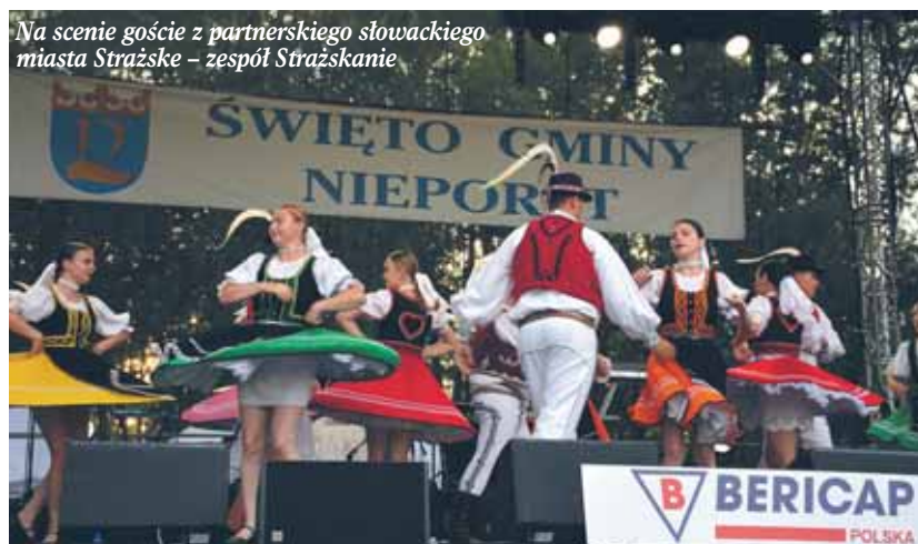
Na scenie goście z partnerskiego słowackiego miasta Stražské – zespół Stražskanie