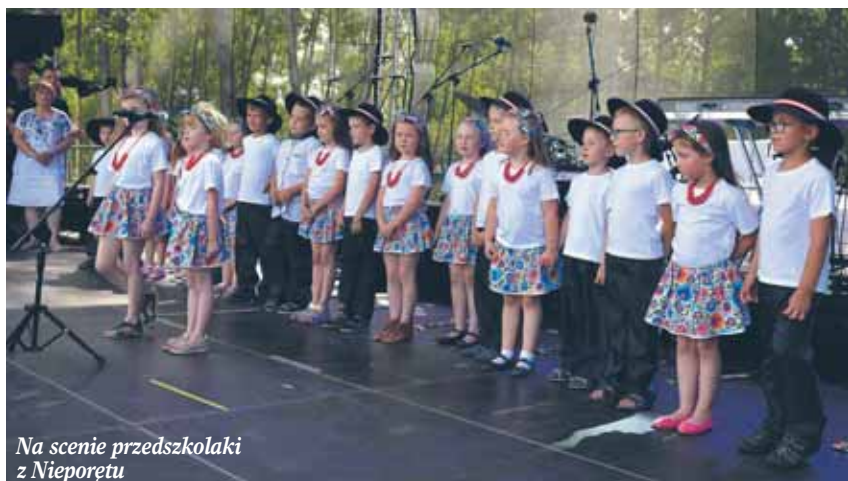
Na scenie przedszkolaki z Nieporętu