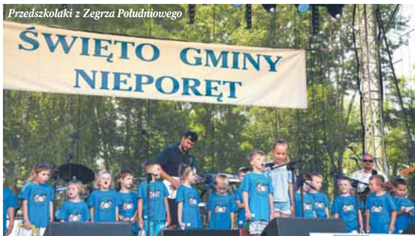
Przedzkolaki z Zegrza Południowego