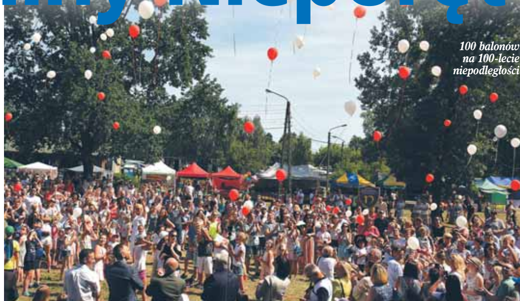
100 balonów na 100-lecie niepodległości