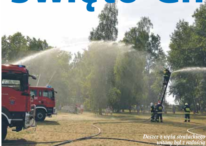
Deszcz z węża strażackiego witany był z radością