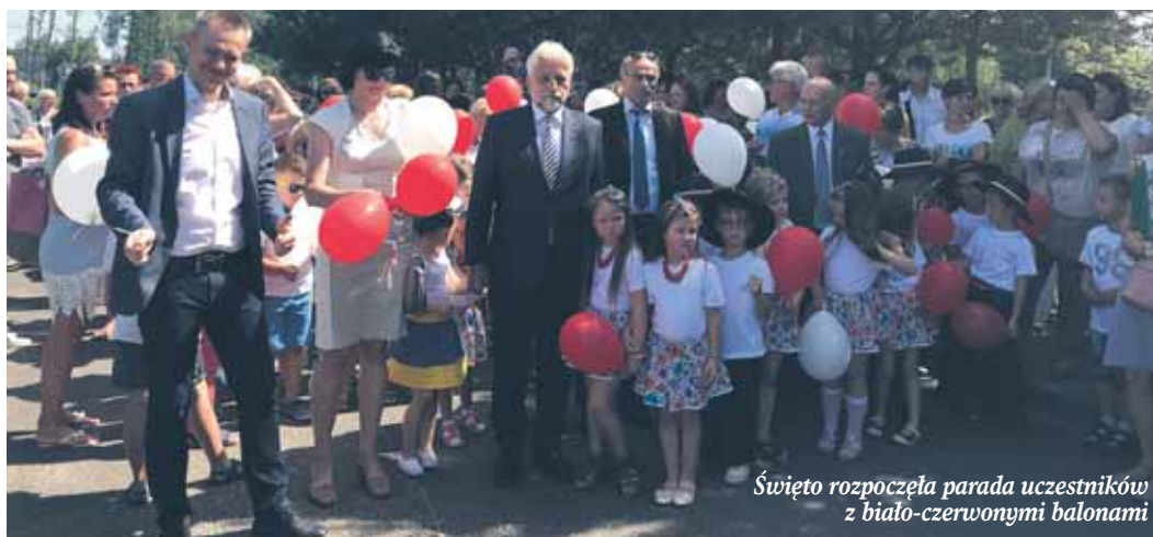
Święto rozpoczęła parada uczestników z biało-czerwonymi balonami